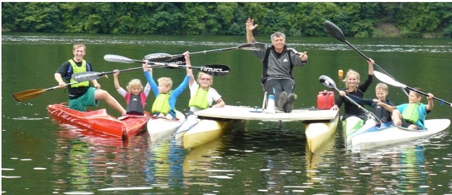
Letní soustředění – Slapská přehrada Častobor

Trénink v našem oddíle není jen o pádlování. Trénink se skládá s široké škály doplňkových sportů jako je běh, plavání, gymnastika, běžecké a sjezdové lyžování, a posilování převážně v hranickém workout parku. V zimních měsících navštěvujeme pádlovací bazén v nedalekém Přerově.