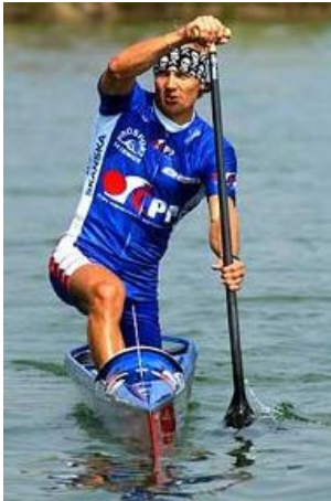
C1 Martin Doktor 2 x OH vítěz

Mezi nejznámější české olympijské medailisty patří: