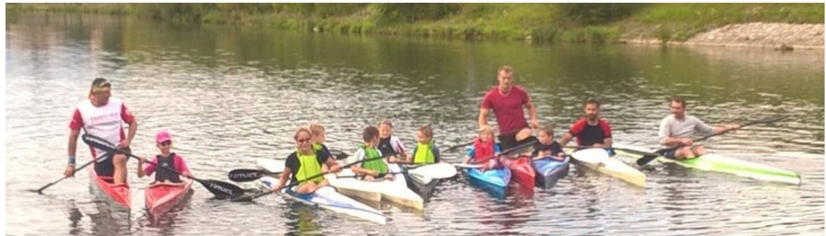
Společný trénink – řeka Bečva Hranice