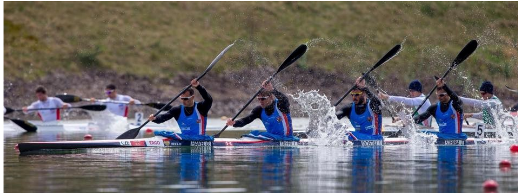
K4 Havel, Trefil, Dostal, Štěřba 2 x 3. místo OH