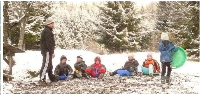
Zimní soustředění – Velké Karlovice