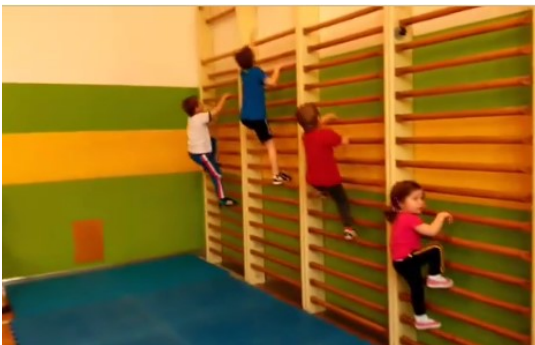
Všeobecná příprava – ZŠ Drahotuše